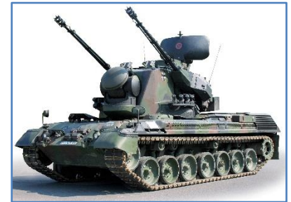
Hans-Hermann Bühling, CC BY-SA 3.0 , via Wikimedia Commons